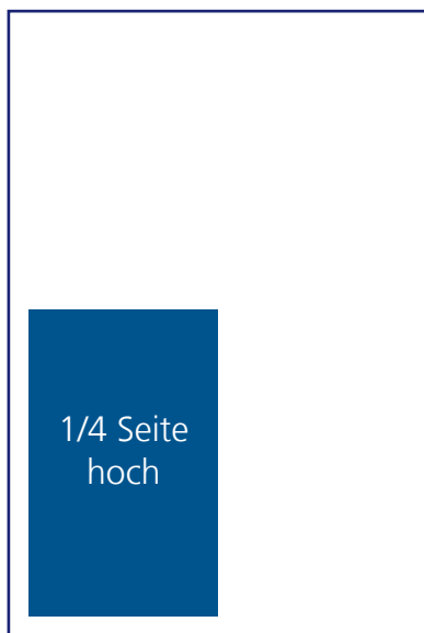
1/4 Seite: 87,5mm x 125mm € 115,--