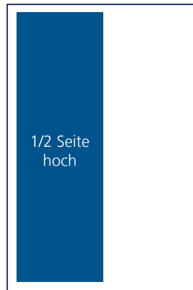
1/2 Seite: 87,5mm x 235,5mm € 96,--