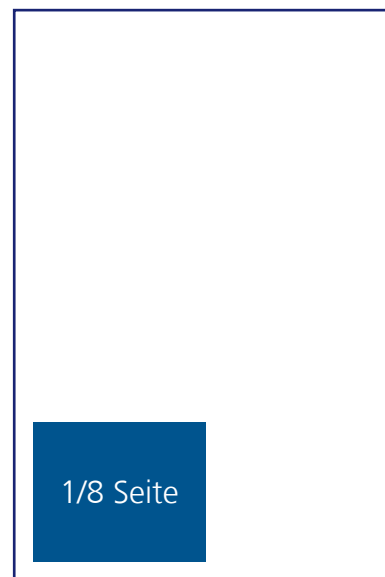
1/8 Seite: 87,5mm x 62,5mm € 30,--

Redaktionelle Gestaltung der Einschaltung Werbewirksame Präsentation KEINE Logo-Platzierung - nur Text und Bilder