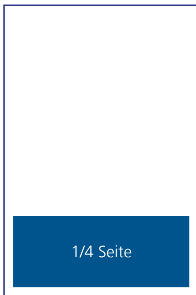
1/4 Seite: 180mm x 62,5mm € 55,--