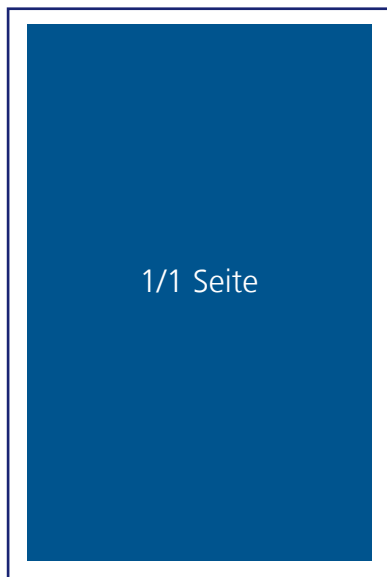
1/1 Seite: 180mm x 235,5mm € 181,--