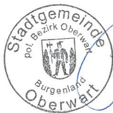
Bürgermeister Georg Rosner

Sollten ein oder mehrere Punkte dieser Vereinbarung nicht erfüllt werden, besteht seitens des Rechtsträgers ein Widerruf der Aufnahme Ihres Kindes. Wir sind für die Anliegen der Eltern offen, möchten aber darauf hinweisen, dass wir, um den reibungslosen Ablauf des Kindersommers gewährleisten zu können, persönliche Wünsche und Forderungen nicht erfüllen können.